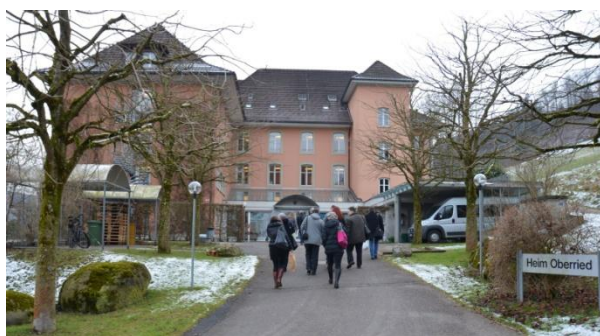
Domov Oberried v Belpu