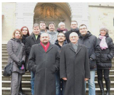
Účastníci studijní cesty