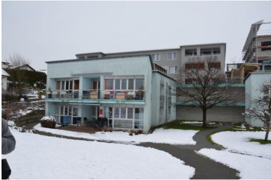
Sonnweid se skládá z několika budov, uživatelé jsou rozděleni podle stupně demence

Program studijní cesty pokračoval ve středu v Lucernu ve vzdělávacím centru CURAVIVA. V první části workshopu byl představen nový zákon na ochranu práv dospělých, který vstoupil v platnost 1. 1. 2013, a v něm zakotvené omezení svéprávnosti, institut projevené vůle, eutanázie, restriktivní opatření atd. Účastníci byli dále seznámeni se systémem podpory rodin, které pečují o svého příbuzného s demencí. Této problematice je ve Švýcarsku věnována velká pozornost a poradenství v této oblasti je na velmi vysoké úrovni. Podpora rodinám má za cíl co nejdelší setrvání člověka s demencí v domácím prostředí. Ve Švýcarsku existuje bohatá síť poradenských center a dostupné domácí péče (Spitex).