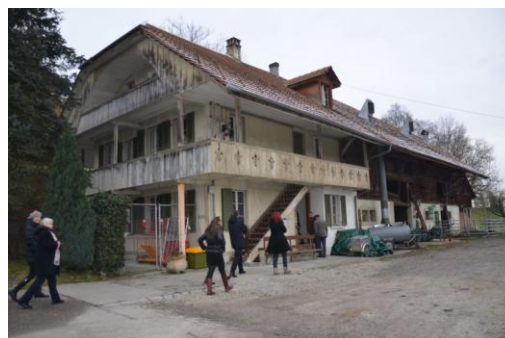
Statek, který je využíván k aktivizaci uživatelů

Následující den účastníci navštívili společnost Sonnweid AG v kantonu Curych, která poskytuje služby 155 osobám se středním až těžkým stupněm demence. I toto zařízení se plně specializuje na cílovou skupinu osob s demencí. Důraz je kladen na vytvoření prostředí, ve kterém se uživatelé budou cítit jistě a jejich kvalita života zůstane zachována v co nejvyšší míře. Také zde jsou využívány prvky validace, Bazální stimulace, kinestetiky, velký důraz je kladen na etiku a aktivizaci. Během tří let od nástupu do zaměstnání jsou všichni zaměstnanci proškoleni v těchto 5 oblastech, aby byla zachována kontinuita péče. Zařízení se skládá z několika budov, kde žijí klienti v různých fázích onemocnění. V bytových jednotkách je denní režim podobný chodu domácnosti a uživatelé se ve vysoké míře zapojují do domácích prací. Ošetrovatelské stanice jsou určeny pro osoby vyžadující zvýšenou péči. V tzv. oázách žijí klienti v terminálním stádiu onemocnění. Oázy jsou velké ošetrovatelské místnosti s až 6 lůžky. Tato integrace klientů má za cíl co nejvíce udržet sociální kontakt uživatele s okolím a podpořit tak smyslovou aktivizaci. V žádném oddělení není omezován pohyb klientů ve dne ani v noci, vybavení pokojů je uspořádáno tak, aby bylo používáno co nejméně restriktivních opatření a uklidňujících léků.