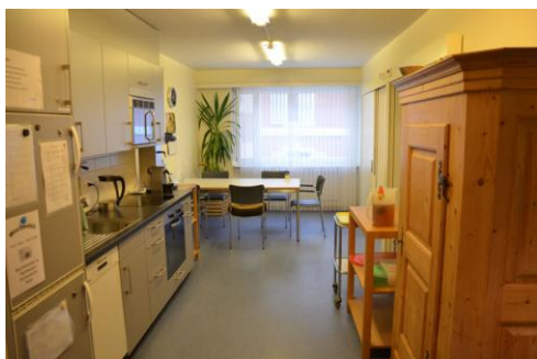
Dandelion v Basileji

Poslední den účastníci strávili v Centru péče o osoby s demencí Dandelion v Basileji, který se od roku 2004 specializuje na péči o osoby s demencí. V současné době má kapacitu 60 lůžek. Zařízení nabízí i denní centrum pro 12 osob. Péče v tomto zařízení je založena na principu normality, lidé s demencí jsou bráni jako „normální“. Uživatelé jsou rozděleni do malých skupin po 6 až 9. Stará se o ně malý, pokud možno stabilní tým. Pracovníci jedí spolu s uživateli u jednoho stolu, jsou oblečeni v civilním oblečení, snaží se klienty zapojit do domácích prací.